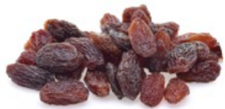
UVAS DE PASA