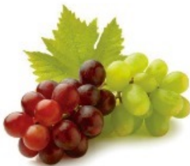
UVAS DE VINO